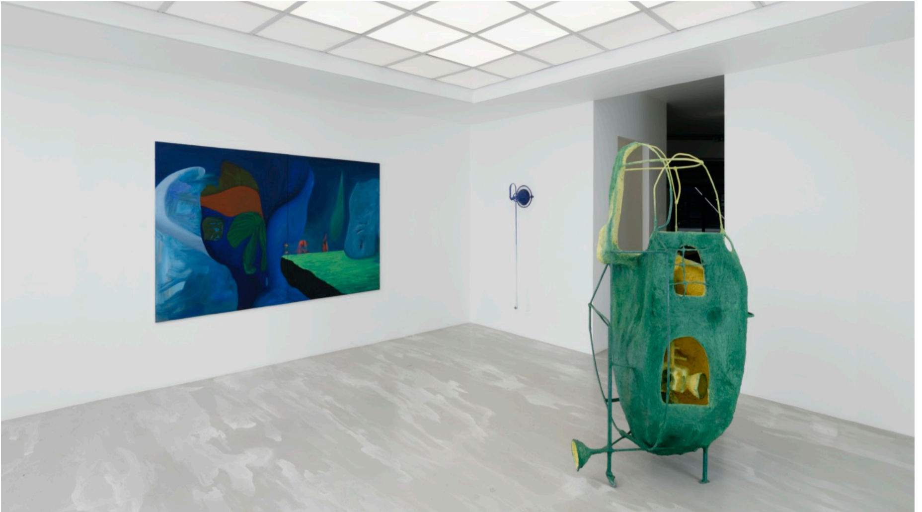
Exhibition view 'Confab Window', duo-show Olivia Bax and Veronika Hilger curated by Thomas Conchou by HATCH.

HATCH a le plaisir de vous annoncer que nous prendrons l'espace de la Galerie Poggi pendant Paris+.