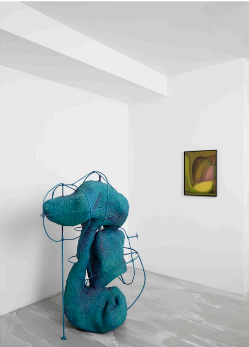
Exhibition view 'Confab Window', duo-show Olivia Bax and Veronika Hilger curated by Thomas Conchou by HATCH.